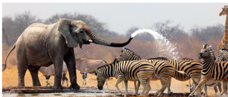
Nacionalni park Tsavo West