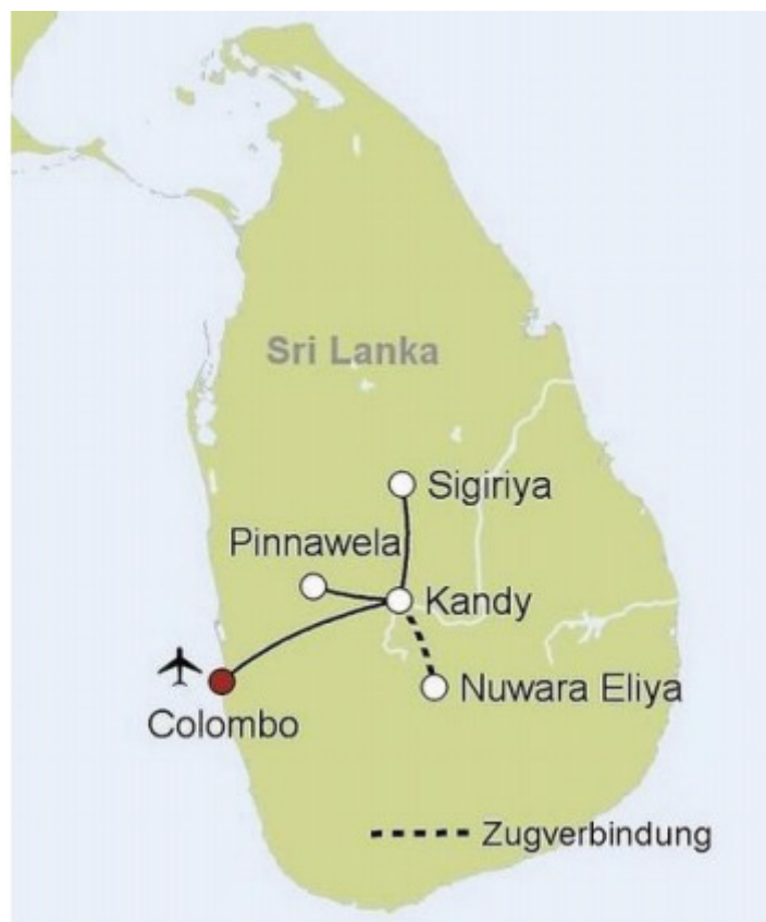
Kompakt kružna tura