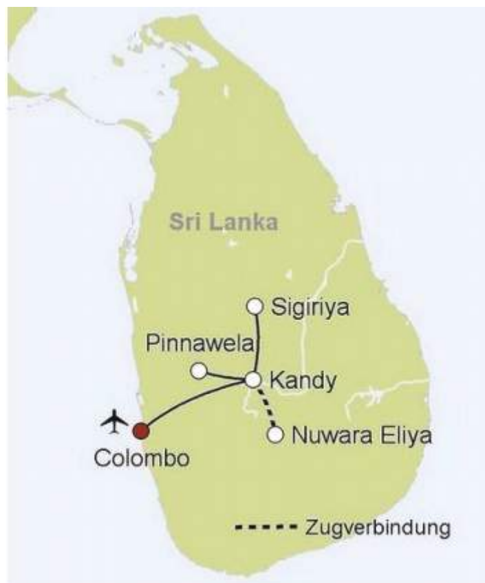
Kompakt kružna tura