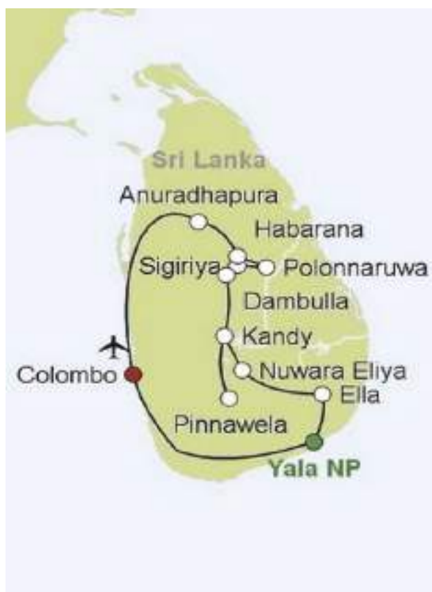
Šri Lanka Classic